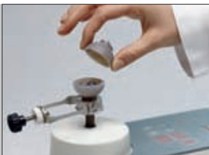
Просто и эффективно