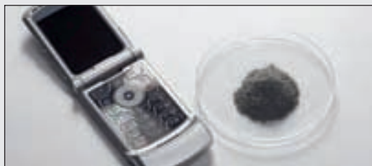
Клавиатура сотового телефона: результат измельчения после охрупчивания в условиях заморозки

Для измельчения отдельных электронных компонентов, например, сотовых телефонов для анализа по RoHS, вибрационная микромельница FRITSCH PULVERISETTE 0 – в зависимости от свойств пробы при комнатной температуре или при криогенном измельчении после охрупчивания жидким азотом в практичном сосуде FRITSCH Кryo-Vox – показывает очень хорошие результаты.