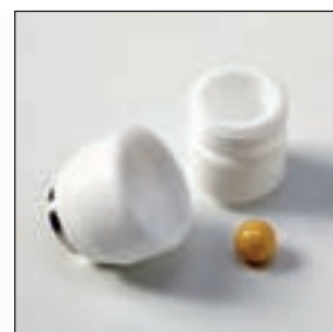
Стакан из тефлона (PTFE)

Ультра-компактная мини-мельница FRITSCH это идеальная помощница для тонкого измельчения самых малых количеств – в жидкой среде, а также всухую или криогенного. Ее специальные шарообразные размольные стаканы обеспечивают значительно более высокую эффективность при измельчении, смешивании и гомогенизации, чем у сравнимых моделей. Занимая площадь всего лишь 20 x 30 см и имея вес в 7 кг, она беспрепятственно помещается повсюду, хорошо смотрится, особенно доступна в управлении и обслуживании, доступна по цене и убеждает отличными результатами: маленькая, быстрая, эффективная.