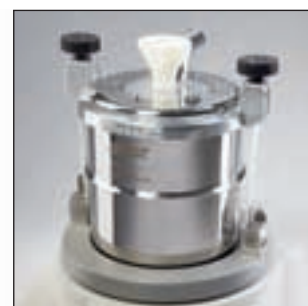
Сосуд FRITSCH Kryo-Box для быстрого, простого охрупчивания

Мельница FRITSCH PULVERISETTE 0 это идеальная лабораторная мельница для тонкого измельчения среднетвердых, хрупких, влажных или чувствительных к температуре проб – в сухой среде или в суспензии – а также для гомогенизации эмульсий и паст.