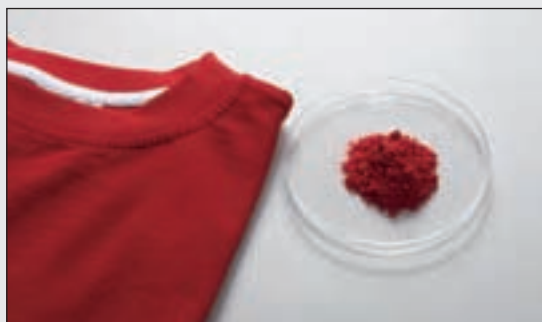
Брикетированные элементы из KBr для исследования проб волокон

Для исследования волокон при помощи инфракрасной спектроскопии мельница PULVERISETTE 23 обеспечивает идеальную подготовку пробы для создания гомогенных брикетированных элементов из бромида калия (KBr). При добавлении 20 мг KBr она за 3 минуты измельчает пробу в гомогенный порошок. При добавлении еще 250 мг KBr, который в течение 90 секунд также был измельчен в PULVERISETTE 23, измельченная проба в течение 30 секунд продолжает измельчаться и гомогенизироваться.