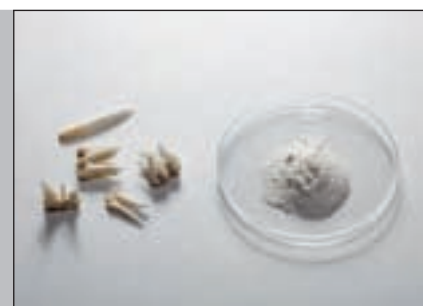
Зубы до и после измельчения с помощью FRITSCH PULVERISETTE 0