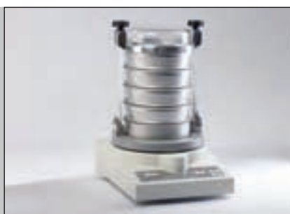
Мельница и Виброгрохот в одном приборе