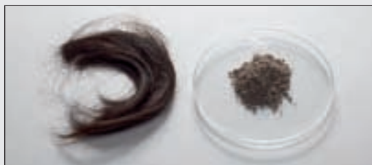
Проба волос – до и после измельчения с помощью PULVERISETTE 23

Для быстрой и простой подготовки проб волос для исследования на наличие наркотиков в мини-мельнице FRITSCH PULVERISETTE 23 примерно 300-500 мг волос при помощи стального шара 15 мм в стальном стакане 15 мл за 5 минут можно измельчить в тончайший порошок (< 100 мкм).